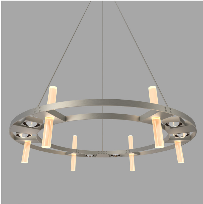
Meridian Ringleuchter P440013B_Vo1.14

Aufbau: in Aluminium gearbeiteter Ringleuchter, mit 3 Lichtebenen (Downlight, Uplight, Raumlicht), 21-flammig, Lichtebenen getrennt steuerbar, Ansteuerung erfolgt über externe DALI-Netzgeräte, 3er-Teilung, stromführende Doppelflanken (30 x 5 mm), Meridian-Strahlerköpfe dreh- und schwenkbar gelagert, lichtleckender Spezialglasstab